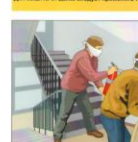
Использовать первичные средства пожаротушения