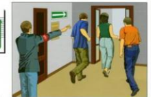
Вывести людей в безопасное место в соответствии с планом эвакуации. Проверить, все ли эвакуированы.