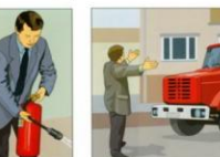
Встретить пожарное подразделение и сообщить, где могли остаться люди, как туда можно добраться.