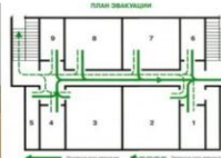
Задействовать план эвакуации. Открыть запасные выходы