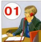
Сообщить о пожаре в пожарную охрану. Задействовать систему оповещения.