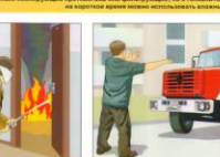
Встретить пожарные подразделения