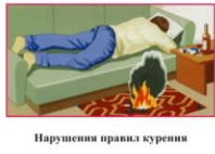
Нарушения правил курения