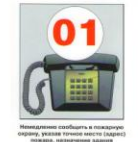
Немедленно сообщить в пожарную охрану, указать точный адрес здания и название улицы