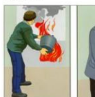
Присутствуя к тушению пожара первичными средствами