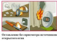
Оставление без присмотра источников открытого огня