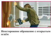
Неосторожное обращение с открытым огнем