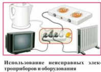
Использование неисправных электроприборов и оборудования