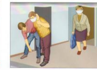
Эвакуировать людей по плану