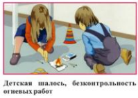
Детская шалость, безконтрольность огневых работ