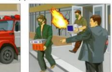
Принять меры к эвакуации имущества