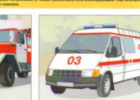
При наличии пострадавших вызвать "скорую медицинскую помощь"