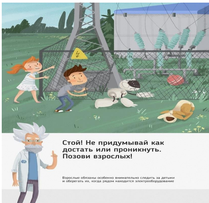
Рис. 5 Стой! Не придумывай как достать или проникнуть. Позови взрослых!