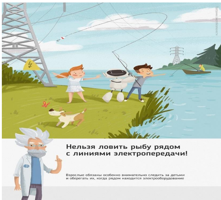
Рис. 4 Нельзя ловить рыбу рядом с линиями электропередачи