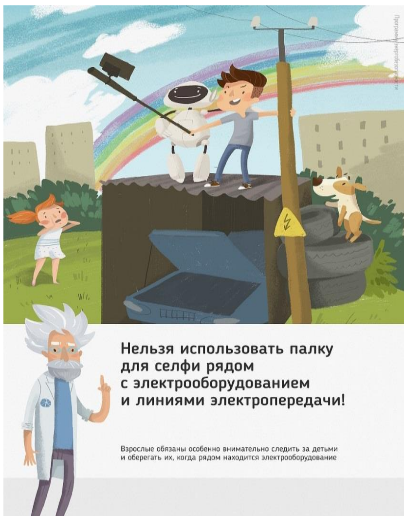
Рис 2. Нельзя использовать палку для селфи рядом с электрооборудованием и линиями электропередачи

Ну и, наконец, нужно повторить с ребенком алгоритм действий в экстремальной ситуации. Проверьте, умеет ли он набирать на сотовом телефоне телефон экстренных служб. Изучите с ним вещества и предметы, которые хорошо проводят электрический ток и потому особенно опасны, и, наоборот, вещества и предметы, плохо проводящие электрический ток и полезные в экстремальной ситуации.