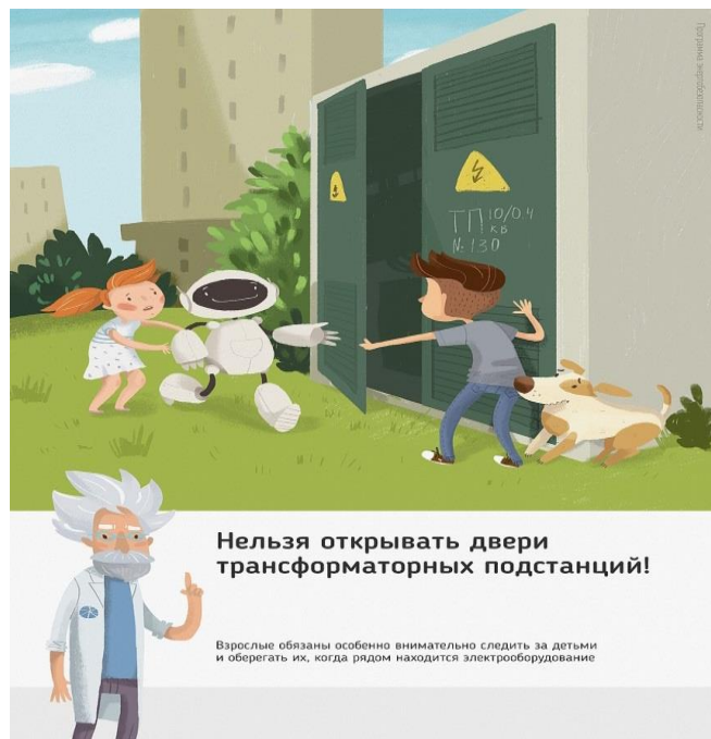
Рис.1 Нельзя открывать двери трансформаторных подстанций

Ежегодно энергетики проводят для школьников познавательные уроки, конкурсы рисунков и историй на тему электричества и правильного с ним обращения. Но работы одних энергетиков в данном направлении недостаточно, для полного понимания проблем электробезопасности нужен пример общества, в котором растет ребенок, и, конечно же, главным образом родителей. Эта работа приносит свои результаты: электротравмы на энергетических объектах единичные, и каждый случай становится поводом для служебной проверки. Но только технических мер мало для того, чтобы полностью обезопасить детей. Им нужен пример родителей.